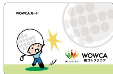
WOWCA カード (当練習場専用の入金式 IC カード)